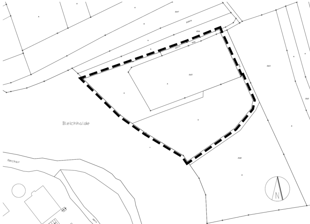
Abbildung 2: Geltungsbereich des Bebauungsplans Sondergebiet „Hundeübungsplatz Bleichhalde“ (ohne Maßstab)

Nr. 2115 und in Teilen Nr. 2117/1 und 2118.