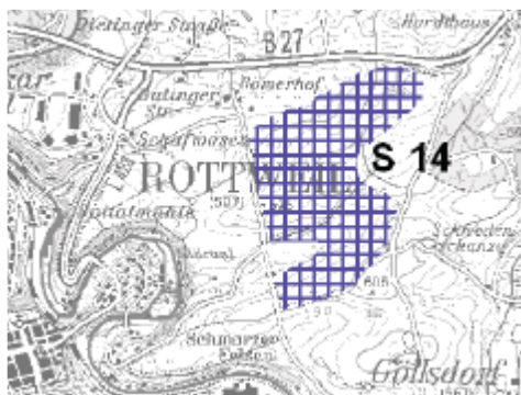
Abbildung 4: Broschüre Regionalplanfortschreibung, Rohstoffsicherung (Auszug ohne Maßstab)

In der zwischenzeitlich vorliegenden Fortschreibung des Regionalplans (Stand Januar 2010) bezieht sich die Fläche zur oberflächennahen Rohstoffsicherung auf die Bereiche östlich an das Planungsgebiet angrenzend.