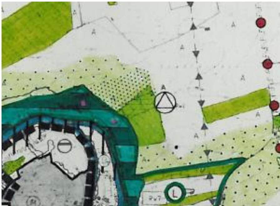
Abbildung 1: Landschaftsplan Verwaltungsgemeinschaft Rottweil - Entwicklungsplan (Auszug ohne Maßstab)

Folgende Entwicklungsvorschläge sind im Entwicklungsplan des Landschaftsplans dargestellt: