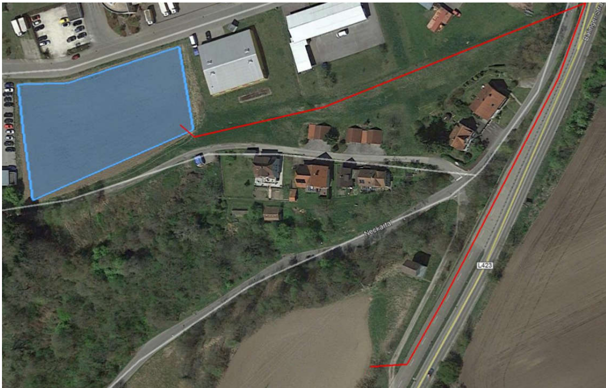
Abbildung 2: Alternativer Fußweg zwischen Parkplatz und Neckar-Line

Für den Bereich des Berner Feldes sind Fußwege von der Haltestelle Seehof, vom Parkhaus am Turm und vom Turm selbst in Richtung Brücke erforderlich. Diese sind entsprechend auszuschildern. Vom Parkplatz der Hängebrücke besteht Sichtkontakt zur Brücke, so dass hier im Falle des Fußwegs über den Schafwasen eine einfache Wegweisung ausreicht. Als Alternative zum Fußweg über den Schafwasen, der die Überwindung eines Höhenunterschieds erfordert, wäre auch die nachfolgend skizzierte Wegführung am Hang entlang zur Balingen Straße und dann zum Zugang der Brücke möglich, die weitgehend ebenerdig verläuft.