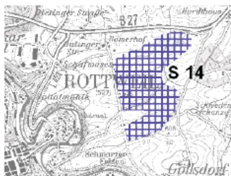
Abbildung 4: Broschüre Regionalplanfortschreibung, Rohstoffsicherung (Auszug ohne Maßstab)

In der zwischenzeitlich vorliegenden Fortschreibung des Regionalplans (Stand Januar 2010) bezieht sich die Fläche zur oberflächennahen Rohstoffsicherung auf die Bereiche östlich an das Planungsgebiet angrenzend.