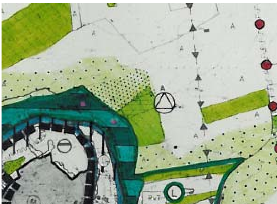
Abbildung 1: Landschaftsplan Verwaltungsgemeinschaft Rottweil - Entwicklungsplan (Auszug ohne Maßstab)

Folgende Entwicklungsvorschläge sind im Entwicklungsplan des Landschaftsplans dargestellt: