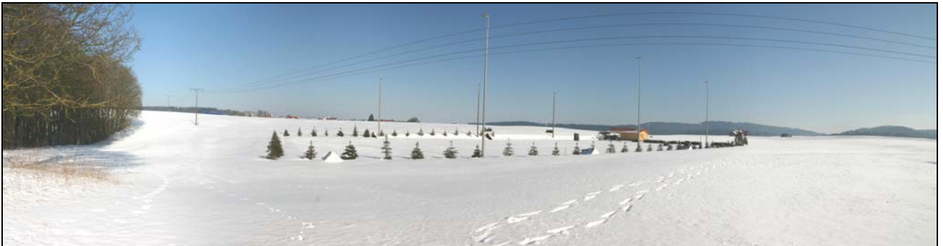
Panoramaansicht aus Südwesten auf den bestehenden Hundeübungsplatz (Februar 2010)

Ca. 30 bis 50 m westlich des Übungsplatzes befindet sich der straucharme, beschattete (nordostexponierte) und weitgehend offene Waldrand des anschließenden Hangwalds (Laubmischwald) des Neckartals, der als Habitat und Biotop höherwertig einzustufen ist, hier ist insbesondere mit geeigneten Lebensräumen für die Avifauna und Fledermausarten zu rechnen.