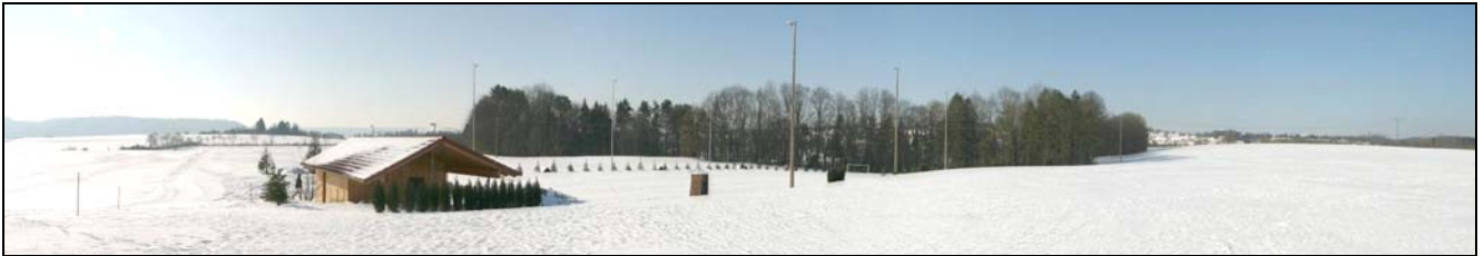
Panoramaansicht aus Nordosten auf den bestehenden Hundeübungsplatz (Februar 2010)

Die Anlage ist mit jüngeren standortfremden und vorwiegend nichtheimischen Gehölzanpflanzungen eingrünt. Die Zufahrt erfolgt über einen vorhandenen Feldweg. Nach derzeitigem Kenntnisstand wird die Anlage mind. 5-mal in der Woche bis 22.30 Uhr genutzt.